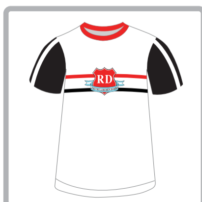
Educación Física: Remera manga corta en tela piqué de poliéster