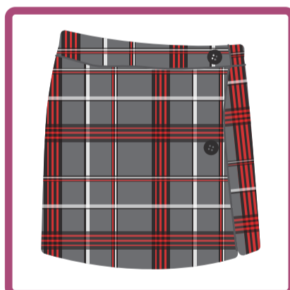
Mujeres: Pollera escocesa. No deberá usarse muy corta