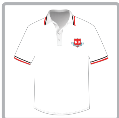
Chomba manga corta