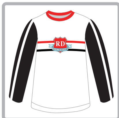
Camiseta manga larga