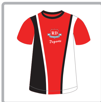
Camiseta deportiva para uso exclusivo en los talleres*