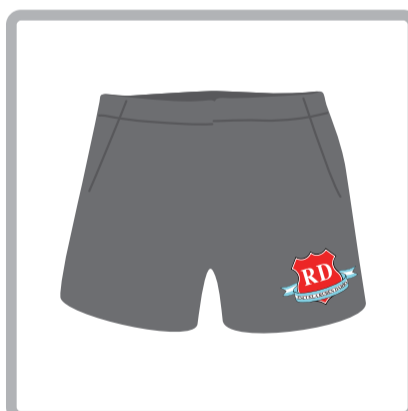
Educación Física: Short gris