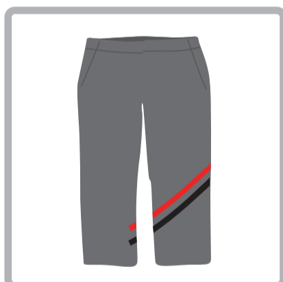
Educación Física: Pantalón gris