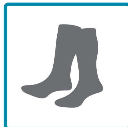
Varones: Medias grises