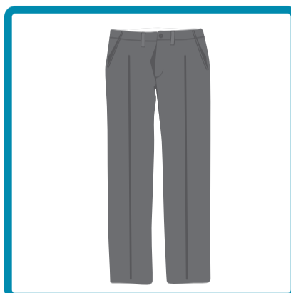
Varones: Pantalón de vestir gris