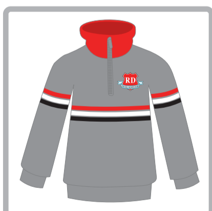
Educación Física: Buzo