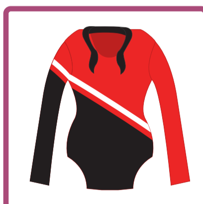
Malla para gimnasia artística