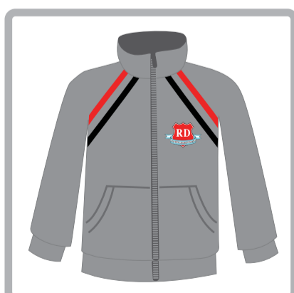
Educación Física: Campera