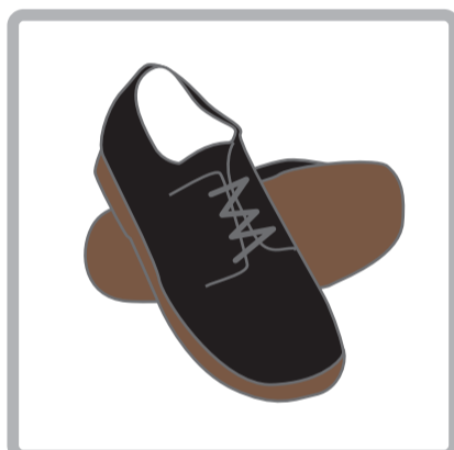
Zapato colegial marrón oscuro o negro