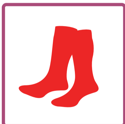
Mujeres: Medias rojas, ¾ o largas