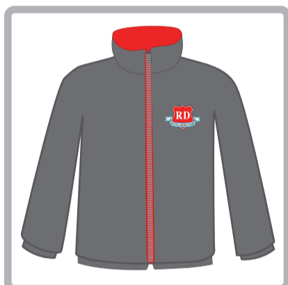
Campera de abrigo